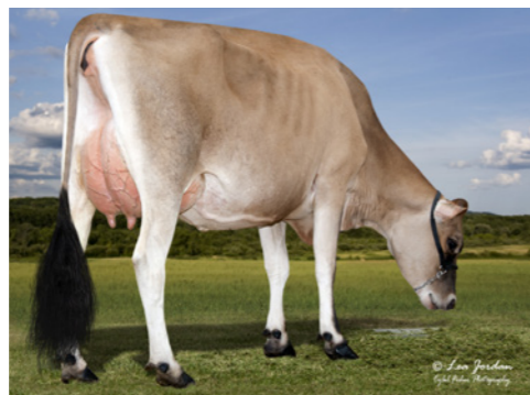
Jx Pvf Prop Joe Zap, moeder van Zander