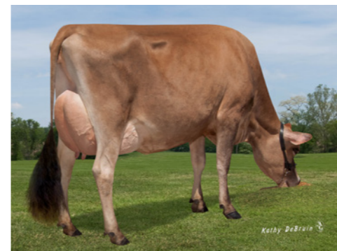
Pine-tree Lexicon Frosty, moeder van Fastidious