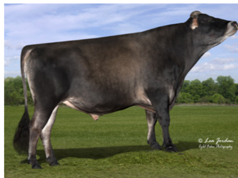
TOG Federer 37562