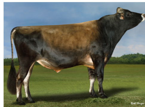
TOG Bronze 36673

*Dochtergetest PP = 100% hoornloze nakomelingen, P = 50% kans op hoornloze nakomelingen *** op onze prijzen is een kortingsmodel van toepassing