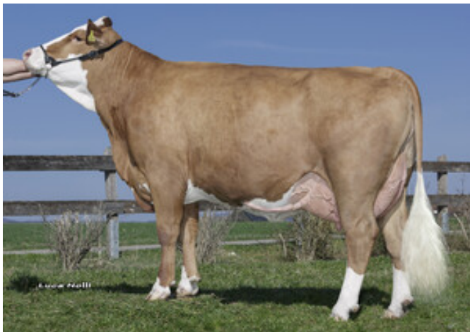
Gudera, Mutter von Warlock Schürer-Hammon GbR, Oettingen