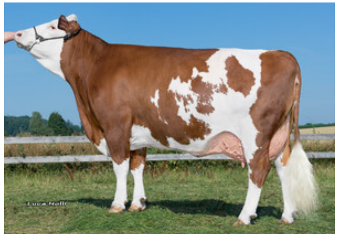
Lamore, Großmutter von Mister X Schürer-Hammon GbR, Oettingen