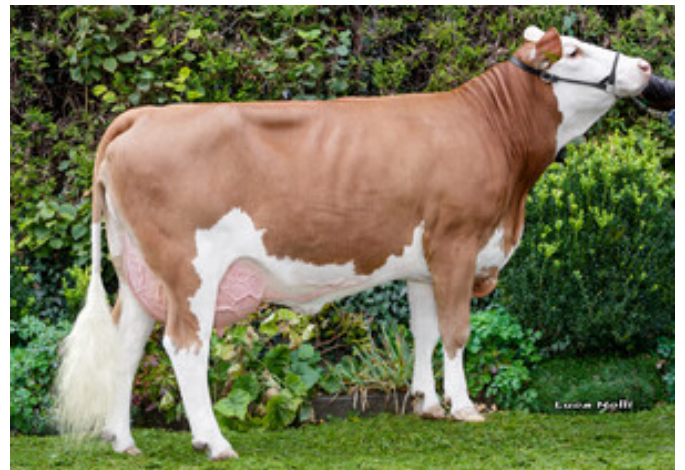
Hanuta, Großmutter von Habanero Wieser GbR, Frauenneuharting