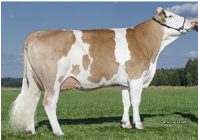
Fabiene, Mutter von Hiller ScheSchu Genetik