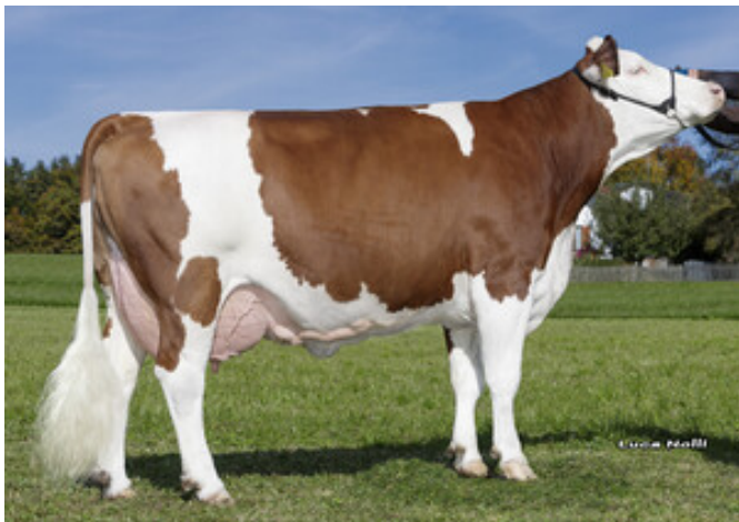
Hanoi, Mutter von Habanero Wieser GbR, Frauenneuharting