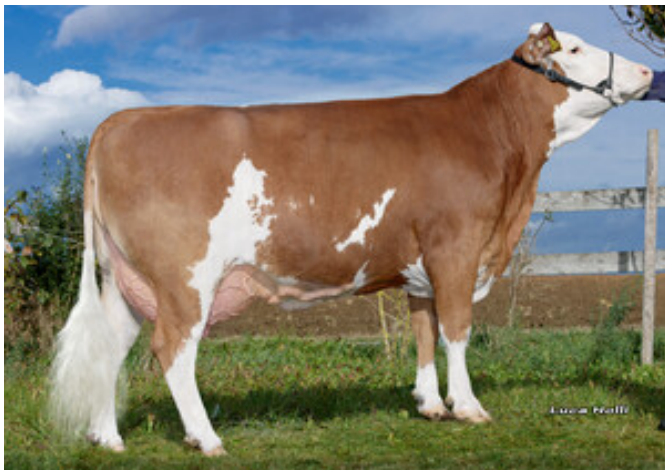
Lavita, Mutter von Mister X Schürer-Hammon GbR, Oettingen