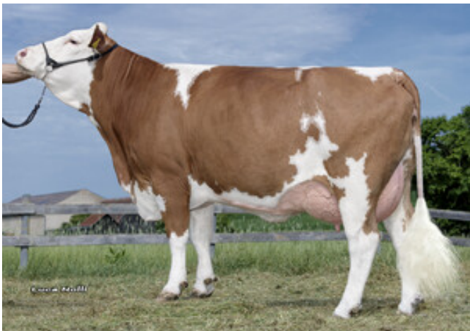
Gacela, Mutter von Han Solo Schürer-Hammon GbR, Oettingen