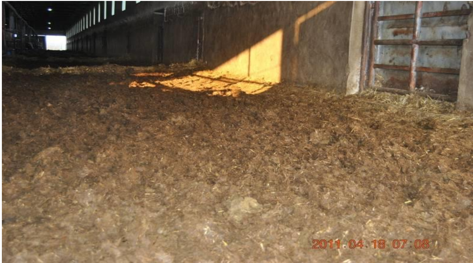
Viditelné efekty použití Z`FIX – 2 aplikace, 2 týdny