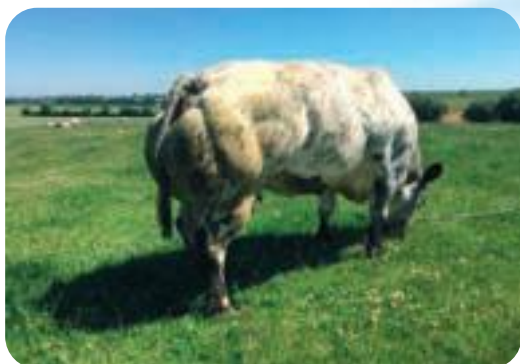
Grappe des Prince de Ligne - Van Heule Elevage sprl - Ligne