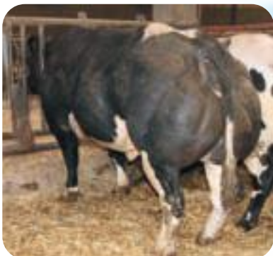
Rocaille d'Argenton - Van Eyck Ph & Charles - Lonzee