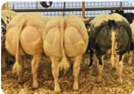
Lot de Cachemire - Libramont 2023 Kalveren van Cachemire - Libramont 2023 Kälber von Cachemire - Libramont 2023