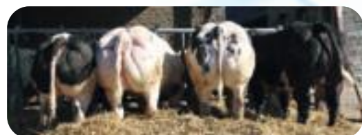
Lot de Filles de Désire - Mailleux Philippe - Marchovelette Dochters van Désire - Mailleux Philippe - Marchovelette Töchter von Désire - Mailleux Philippe - Marchovelette