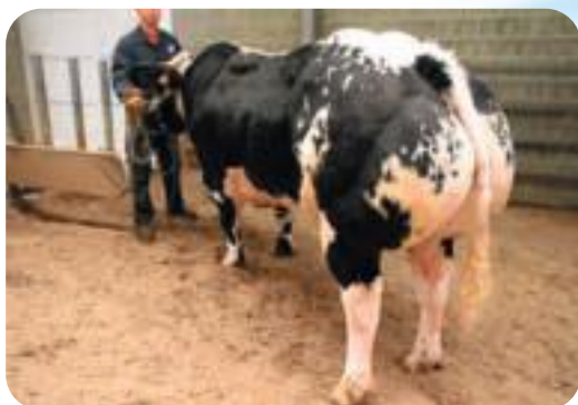
Bresil du Blanc dos (Demi frère) Bresil du Blanc dos (Halbroer) Bresil du Blanc dos (Halbbruder)