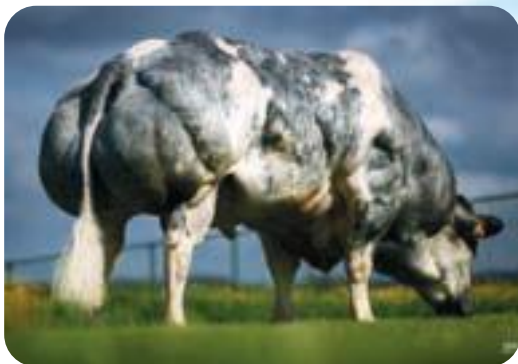
Cachemire de Dessous la Ville