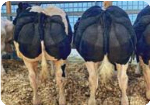
Filles d'Islo - Libramont 2023 Dochters van Islo - Libramont 2023 Töchter van Islo - Libramont 2023