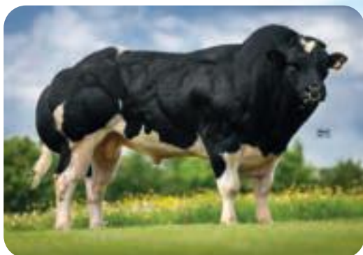
Reflet de Fermine (Fils de Digital) Reflet de Fermine (Zoon van Digital) Reflet de Fermine (Sohn von Digital)