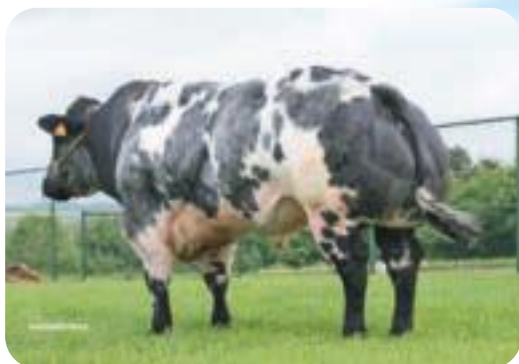
Attribut du Fond de Bois