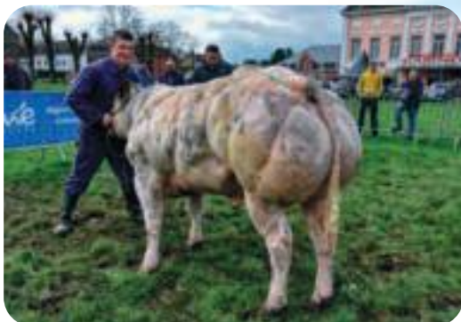
Bagage de l'Escaille (fils de Azghan) Champion à l'expertise Chimay 2024 à Pierrard St & Toussaint B Bagage de l'Escaille (zoon van Azghan) Kampioen Chimay 2024 - Pierrard St & Toussaint B Bagage de l'Escaille (Sohn von Azghan) Sieger Chimay 2024 - Pierrard St & Toussaint B