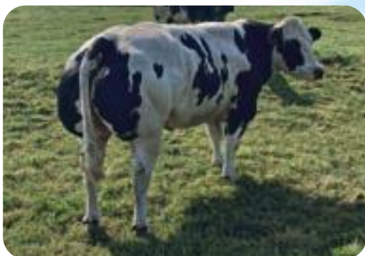
Turlute du Petit Royal