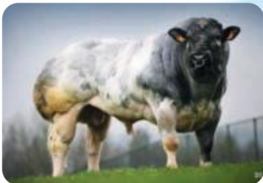
Athos du Rivage