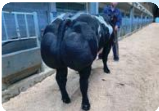
Oulare van den Hondelee