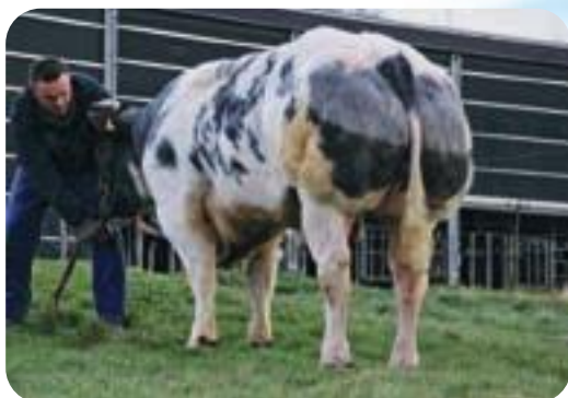
Sherpa de Beaufaux