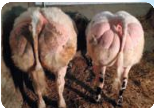
Filles de Cabotin - Melotte Philippe - Lathuy Dochter van Cabotin - Melotte Philippe - Lathuy Tochter van Cabotin - Melotte Philippe - Lathuy