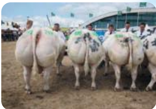
Super Star de Centfontaine