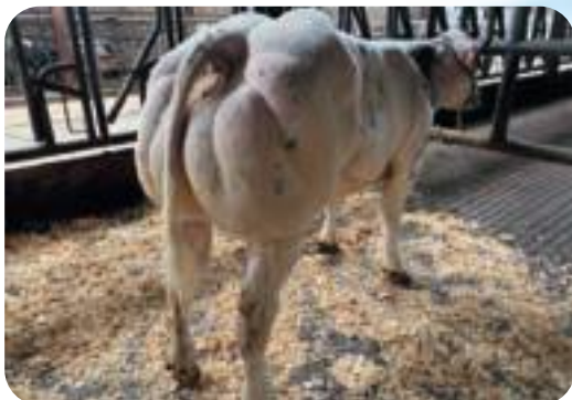
Fille d'Eclaireur - Marcel & Gilles Godefroid - Clavier Dochter van Eclaireur - Marcel & Gilles Godefroid - Clavier Tochter von Eclaireur - Marcel & Gilles Godefroid - Clavier