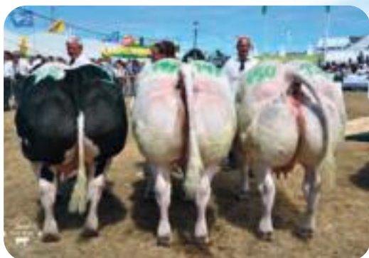
Escadrille de St Fontaine 3ème prix Libramont 2022 Escadrille de St Fontaine 3de prijs Libramont 2022 Escadrille de St Fontaine 3. Preis Libramont 2022