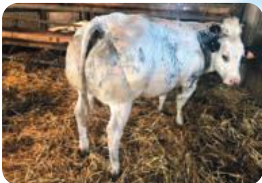
Fille de Rexas - Delvigne Luc - Ere Dochter van Rexas - Delvigne Luc - Ere Tochter von Rexas - Delvigne Luc - Ere