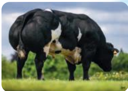
Pépite des Princes de Ligne