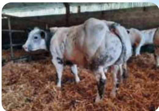
Fille de Gédéon - Rosomme Yves et Christian - St Gérard Dochter van Gédéon in Rosomme Yves & Christian - St Gérard Tochter von Gédéon in Rosomme Yves & Christian - St Gérard