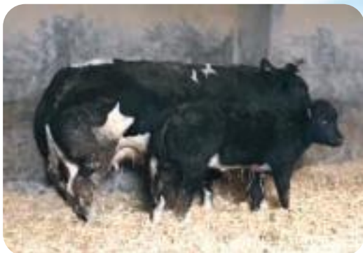
Cerise du Falgi avec son veau Cerise du Falgi met haar kalf Cerise du Falgi mit seinem Kalb