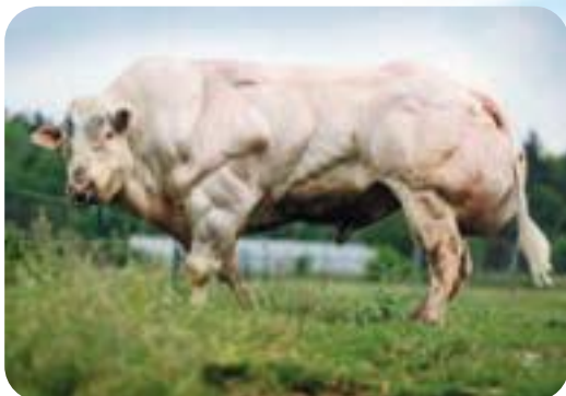
Sénateur de Mehogne