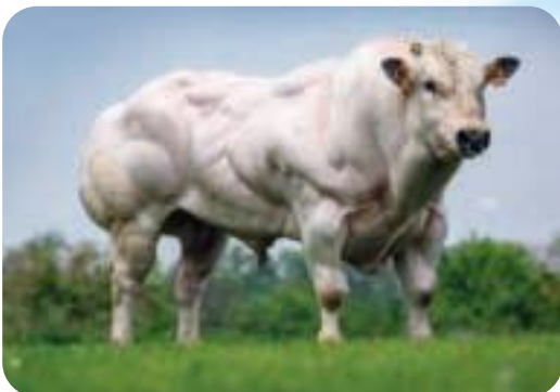
Tête de la coue