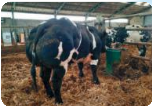
Fils de Oulare van den Hondelee - Burgraff Jean-Pierre - Mettet Zoon van Oulare van den Hondelee - Burgraff Jean-Pierre - Mettet Sohn von Oulare van den Hondelee - Burgraff Jean-Pierre - Mettet