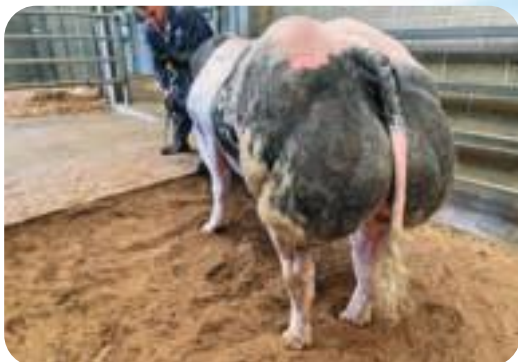
Feston de Belle Eau