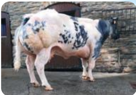
Tribune du grand Hez