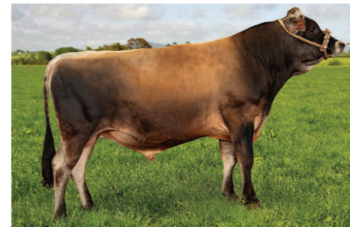
Rocklea Carrick Colonial