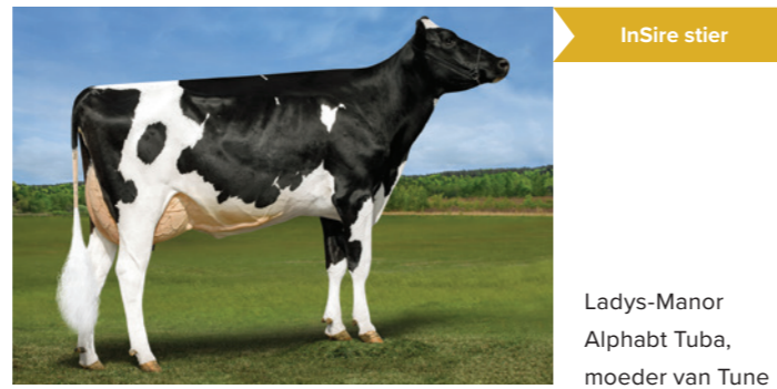
Ladys-Manor Alphabt Tuba, moeder van Tune