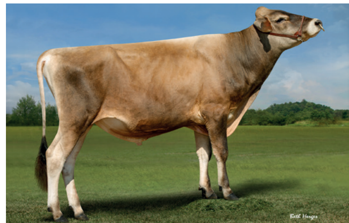
TOG Superneau PP