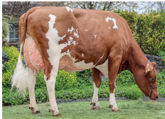
Sunny (v. Der Beste)