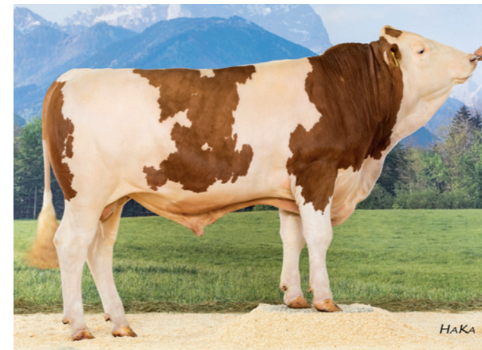
GS Wlan PP