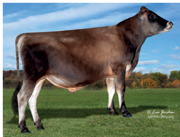
JX Forest Glen Heart (5)